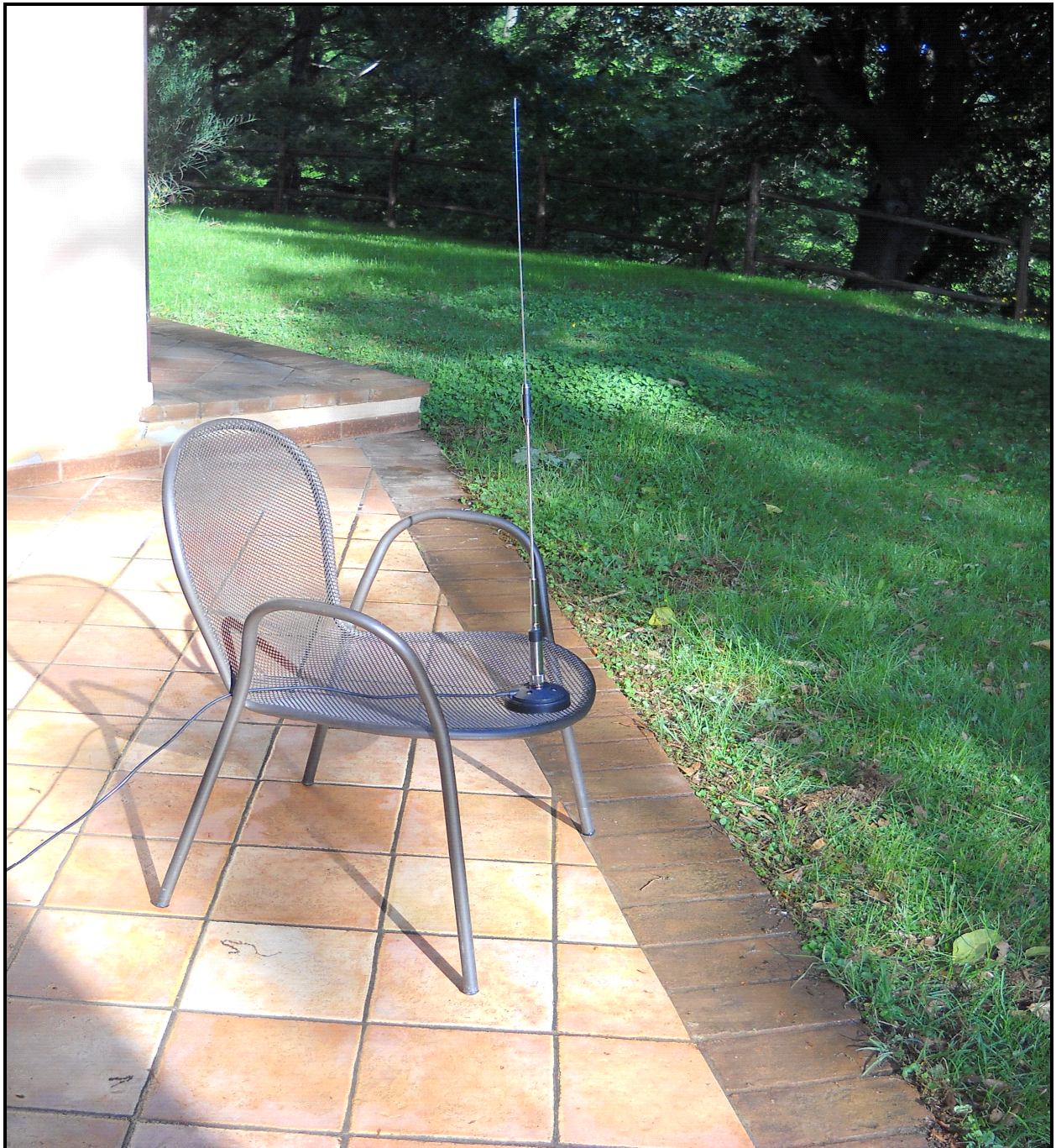
(Antenna Diamond NR770H posta su una sedia di metallo)

In un bel pomeriggio, ho montato la mia antenna da "barra mobile" (Diamond NR770H) dotata di una base magnetica della "Sirio", su una sedia di metallo che potete osservare qui sotto, posta di fronte ad un prato verde immerso in una "lussureggiante" vegetazione.