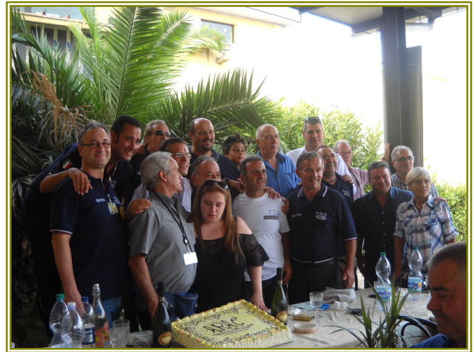
Foto di gruppo