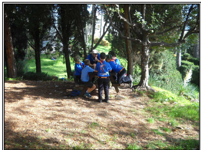
Lupetti in azione...