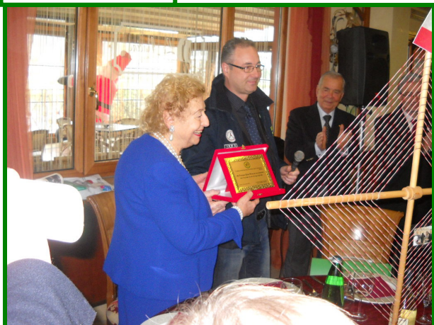
Consegna della targa ricordo dell'A.Ra.C.