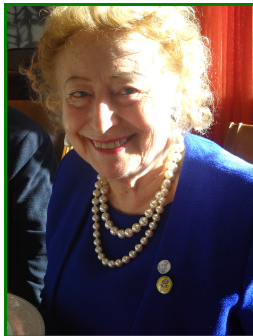
Una bella immagine della Principessa Elettra Marconi che sfoggia con orgoglio gli stemmi dell'A.Ra.C. e del C.I.S.A.R.